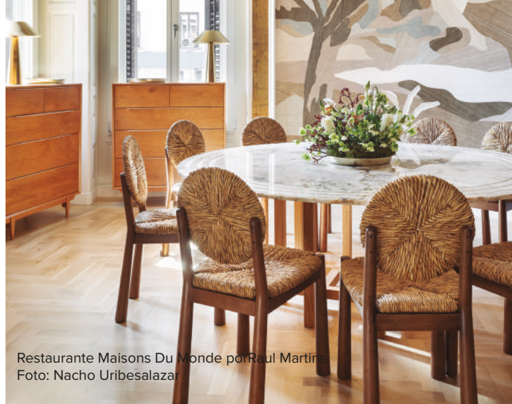
Restaurante Maisons Du Monde por Raúl Martins

Colaboraron STROHM TEKA, STRUGAL, CUPA STONE, GRATO, ANTIGÜEDADES MARSOL E HIJOS, HOMAPAL, y ARBOLANDE.