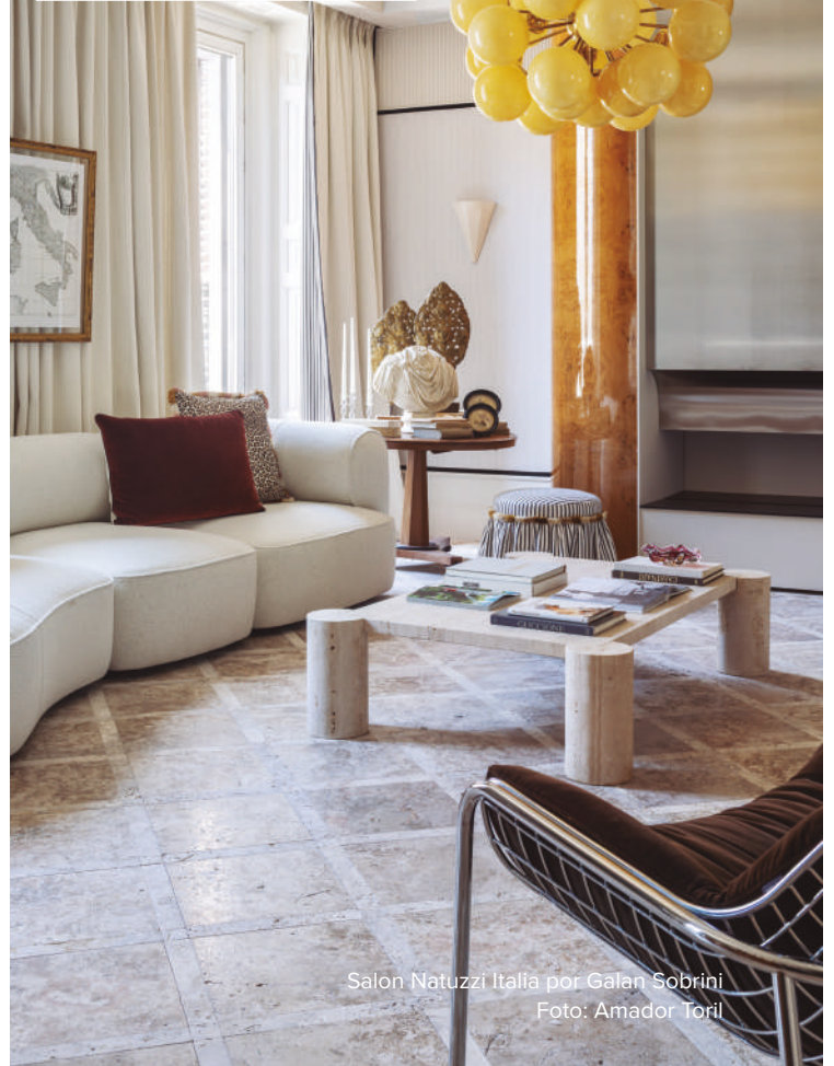
Salon Natuzzi Italia por Galen Sobrini