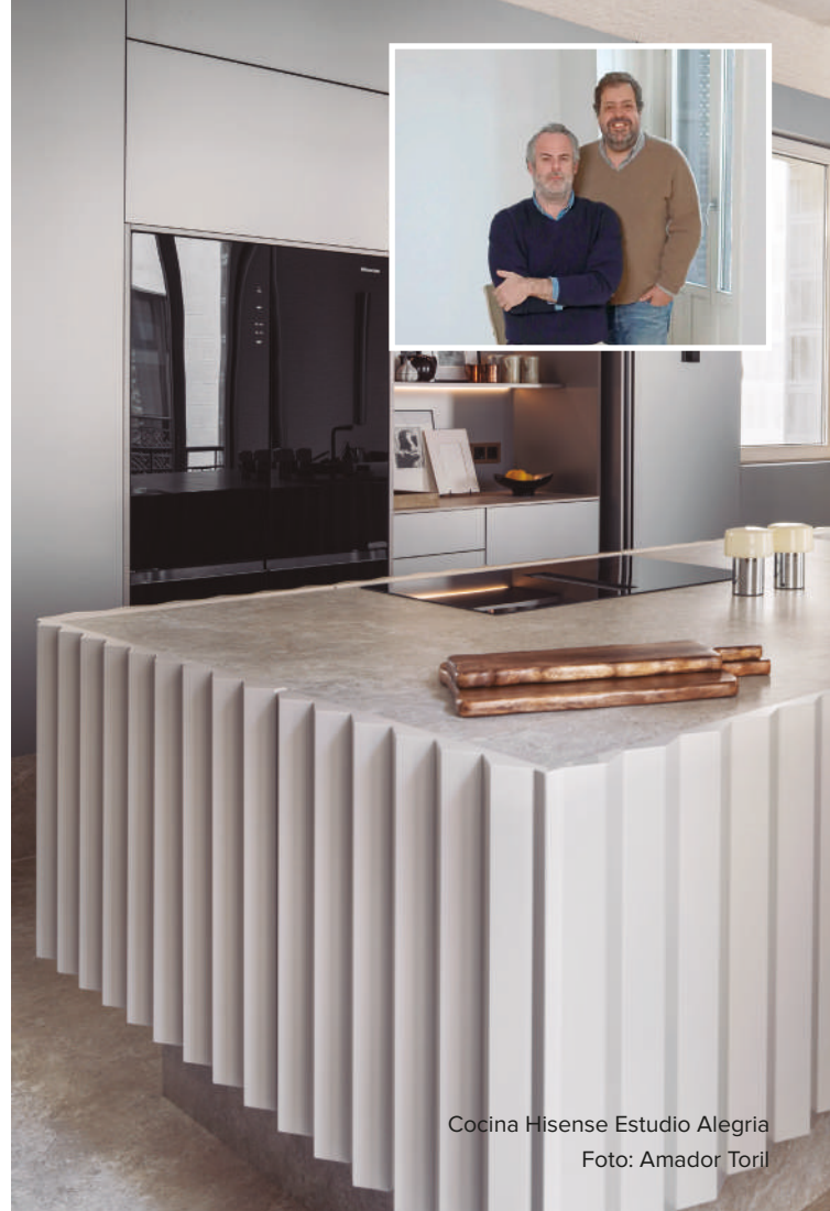
Cocina Hisense Estudio Alegria

La visión arquitectónica y escultural de LÓPEZ Y TENA ARQUITECTOS materializó una selecta y funcional cocina para GRUPO COECO, concebida para vivir de forma relajada; un diseño que se llevó el tercer premio del público.