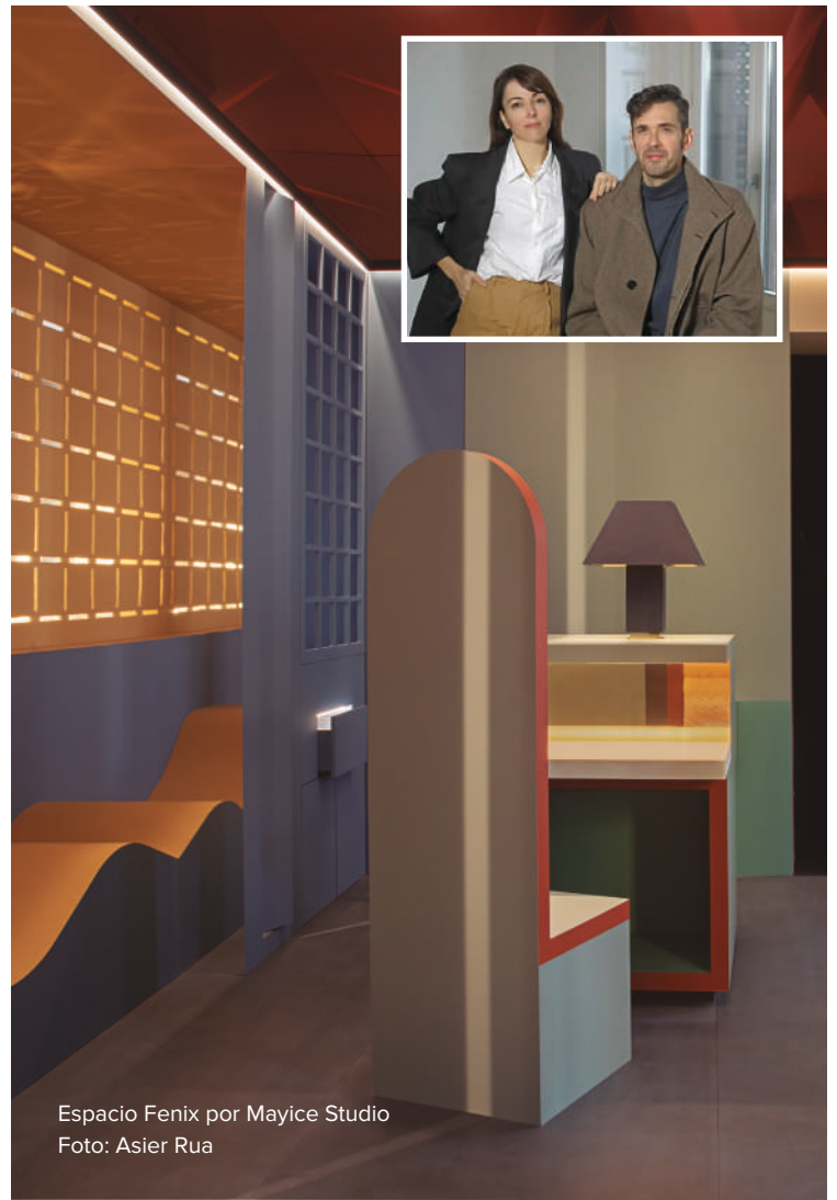
Espacio Fenix por Mayice Studio