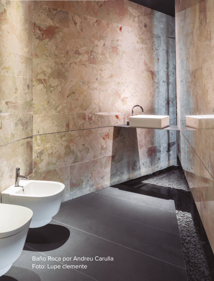
Baño Roca por Andreu Carulla