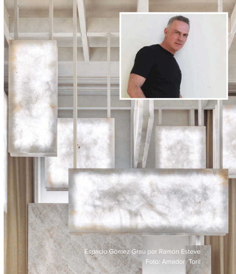
Espacio Gómez Grau por Ramón Esteve

El jurado destacó que este "espacio de paso, aparentemente discreto, logra elevar el concepto a través de una buena ejecución técnica". También la aparente sencillez visual de su "estructura compleja", valorando cómo "el diseñador ha jugado con el espacio, simplificándolo y haciendo fácil lo difícil", ofreciendo "un nuevo enfoque para una marca clásica, creando un espacio interactivo, donde el público se detiene, explora y descubre nuevas capas".