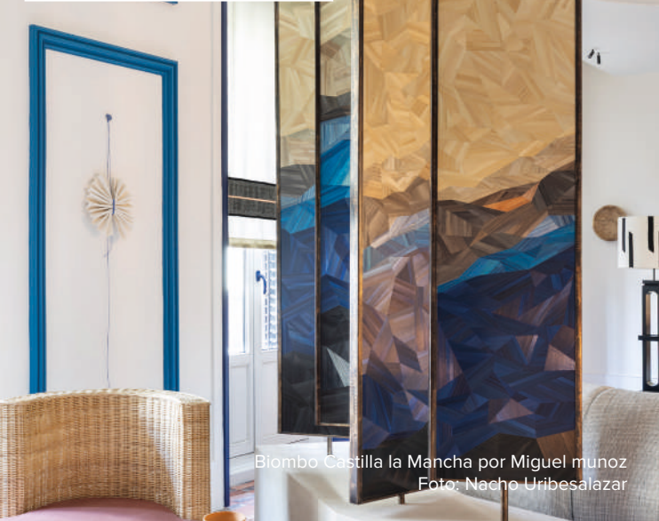
Biombo Castilla la Mancha por Miguel Muñoz