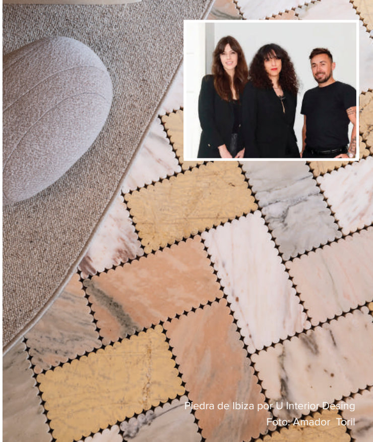
Piedra de Ibiza por U Interior Design