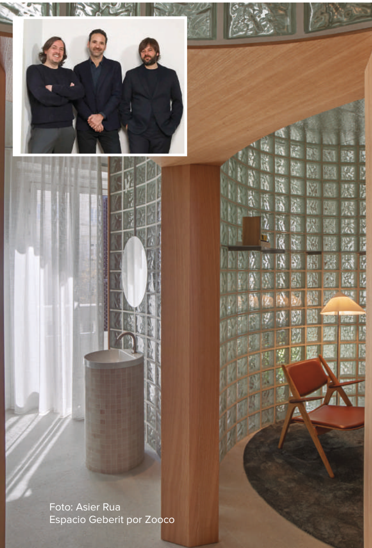
Espacio Geberit por Zooco

Francesc Rifé Studio planteó una visión histórica de las puertas para la firma PROMA. Mediante despieces de madera de roble teñida, generó un recurso físico que intermedaba con fluidez entre distintos espacios. Al mismo tiempo, en una misma puerta se fusionaban pasado y presente: por un lado, con un corte clásico y detallista; por el reverso, con un estilo contemporáneo aséptico, aludiendo así a todas las posibilidades que este elemento sigue ofreciendo al diseño de interiores.