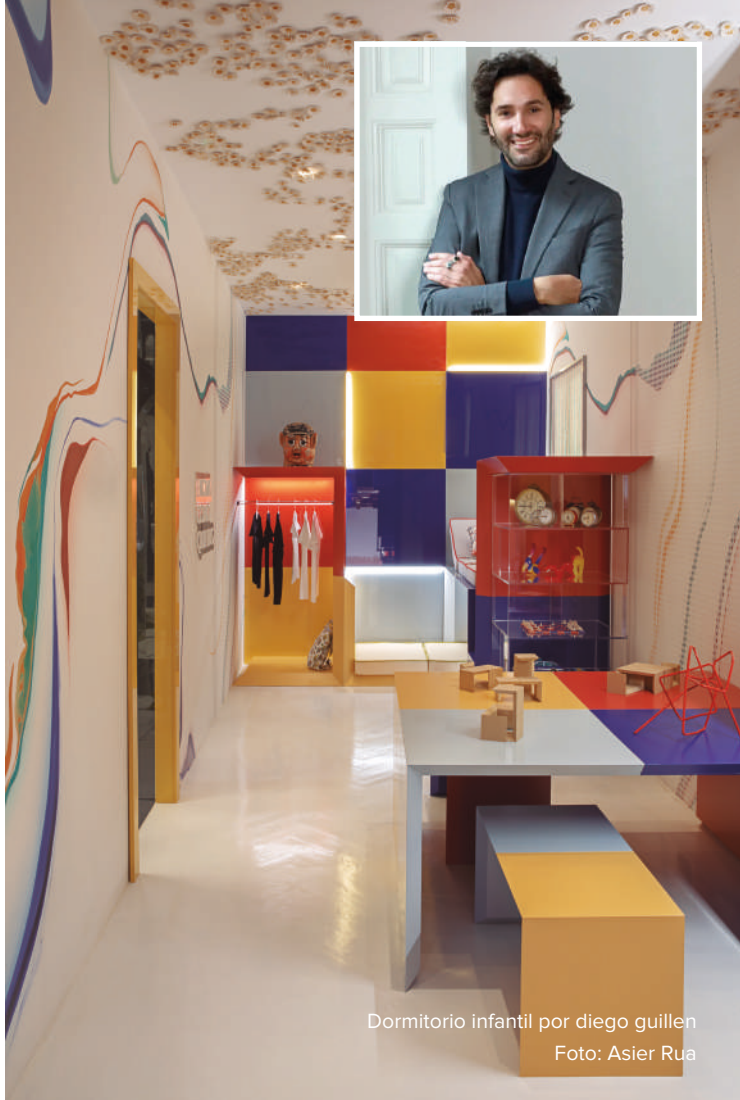
Dormitorio infantil por diego guillen